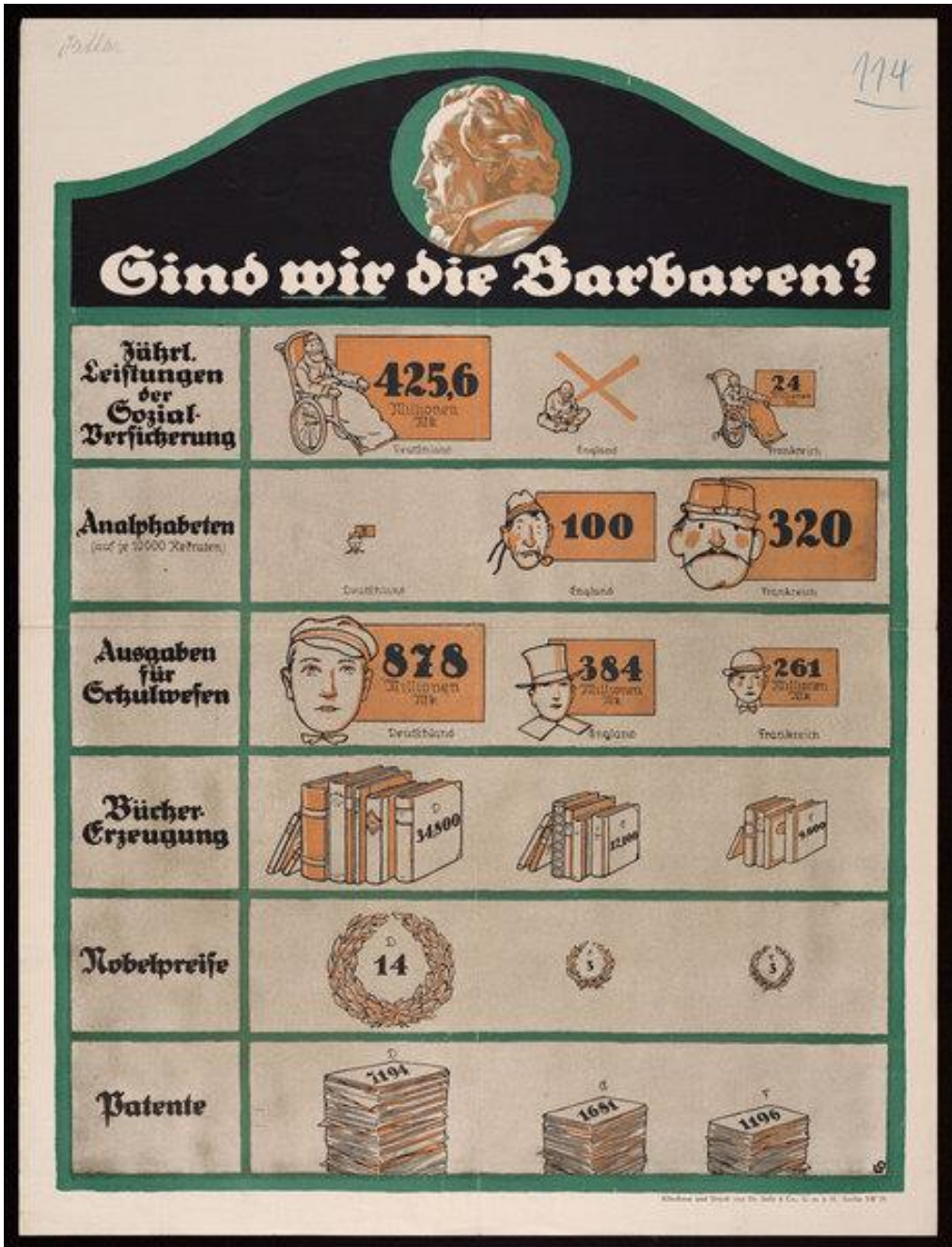
M4 – LOUIS OPPENHEIM, Sind wir die Barbaren? , Propagandaplakat, Deutschland 1916